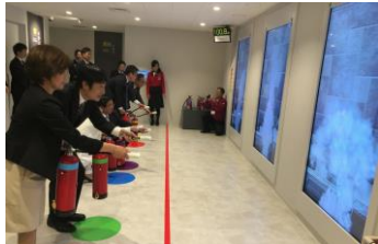
大阪市立阿倍野防災センターにて、災害体験を通して防災知識を得ることができます。