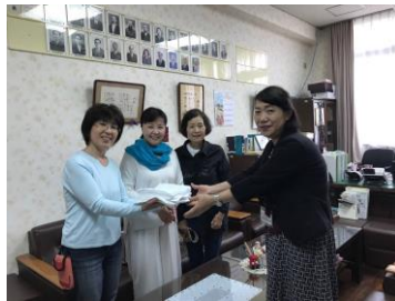
地域の方より中津小学校へ雑巾贈呈(5月)