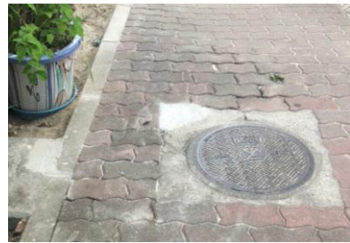
歩道の危険箇所の修繕(長柄中2丁目)8月