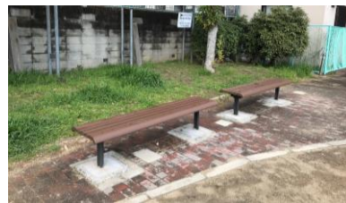
古くなり撤去されたままになっていたベンチを新しく再度設置してもらいました(中津中央公園)