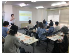
認知症サポーター養成講座を開催 5/22.VRを使い、認知症の方の視点を体験。